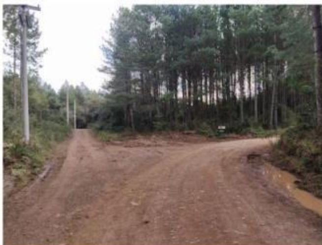
Aproximadamente 2 km após a segunda bifurcação, entrar à direita na terceira e última bifurcação.