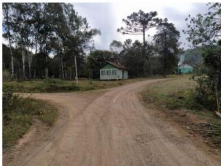
Após aproximadamente 5 km, a primeira bifurcação. Manter-se à direita.