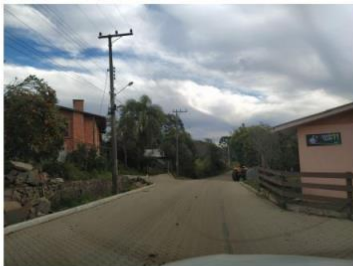
Saída do distrito de Vila São Paulo, sentido capela São João.