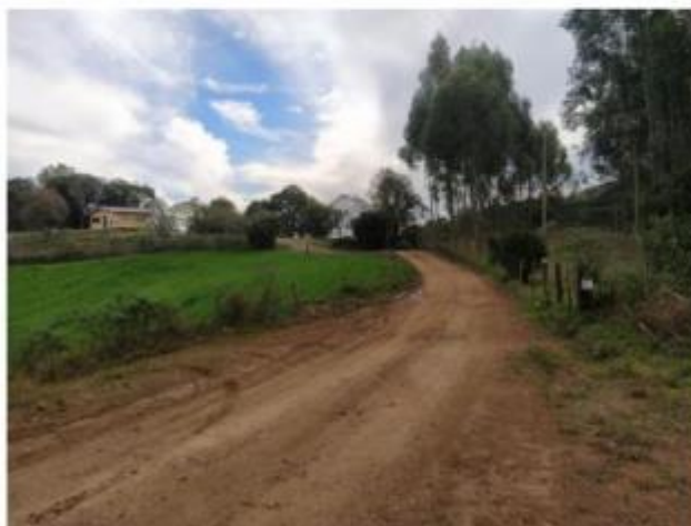
Foto retirada na entrada da propriedade, mostrando a propriedade vizinha, do outro lado da estrada.