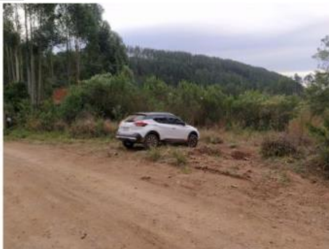
Aproximadamente 500 metros após a última bifurcação está o imóvel, localizado à direita da estrada. O veículo se encontra bem na entrada do imóvel, não há portão ou cerca no local.