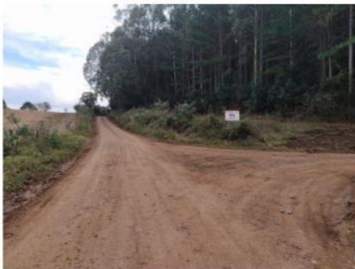
Aproximadamente 500 metros após a primeira bifurcação, manter-se à esquerda na segunda bifurcação.