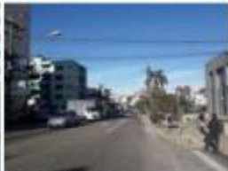
2 Rua Mateo Gama