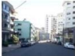
1 Rua Gov. Roberto Silveira