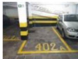
37 Box indicado como nº 09