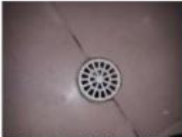
28 Danos no piso do banheiro social 2