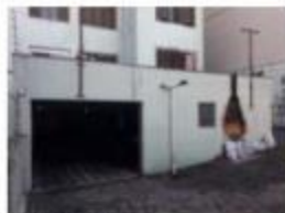
34 Acesso à garagem