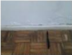
30 Danos no piso e parede do quarto 2