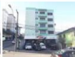
6 Fachada da Rua Mateo Gama