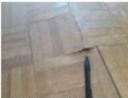
24 Danos no piso da sala 2