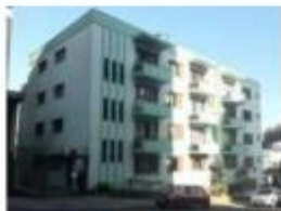
4 Fachada da Rua Gov. Roberto Silveira