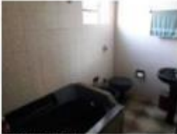
21 Banheiro privado