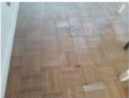
23 Danos no piso da sala 2