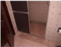
27 Danos no piso do banheiro social 2