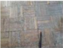
26 Danos no piso da sala 2