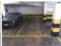
36 Box indicado como nº 08