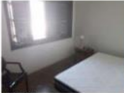
19 Quarto 2