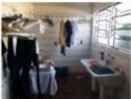
10 Área de serviço