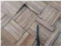
25 Danos no piso da sala 2