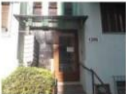
7 Acesso do Bloco A