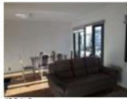
17 Sala 2