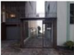
8 Acesso do Bloco B e da garagem