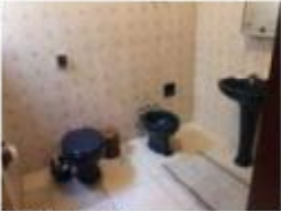
20 Banheiro social 2