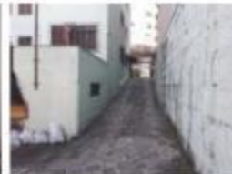
33 Acesso à garagem