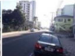
3 Rua Mateo Gama