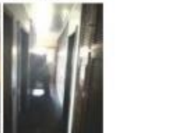
14 Circulação atargada