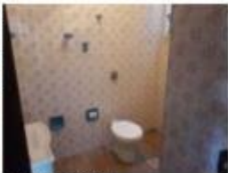
11 Banheiro social 1