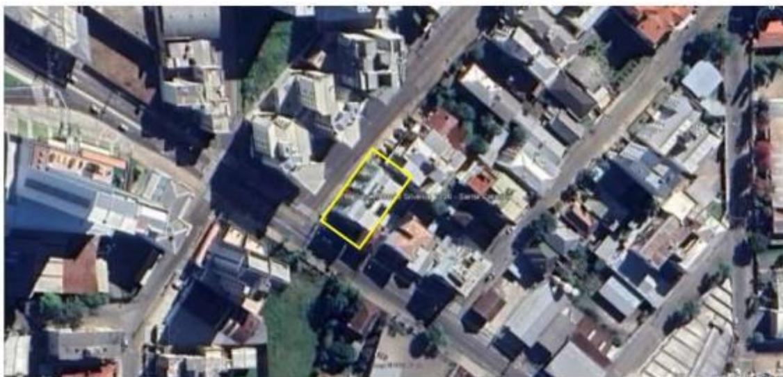
Figura 1 – Imagem por satélite

Fonte: Google Earth (2023) com indicação pelo autor do Laudo do Edifício Aldren