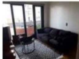
15 Sala 1