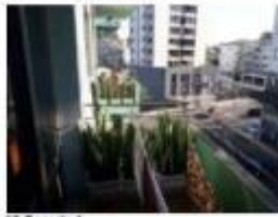
16 Sacada 1