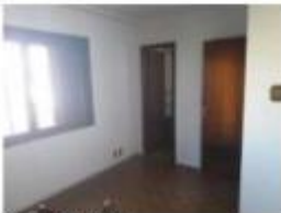
22 Quarto 3 (suite)