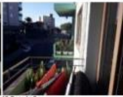
18 Sacada 2