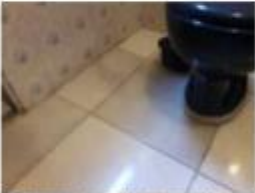
29 Danos no piso do banheiro social 2