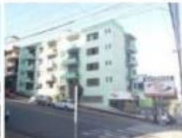
5 Fachadas das duas ruas