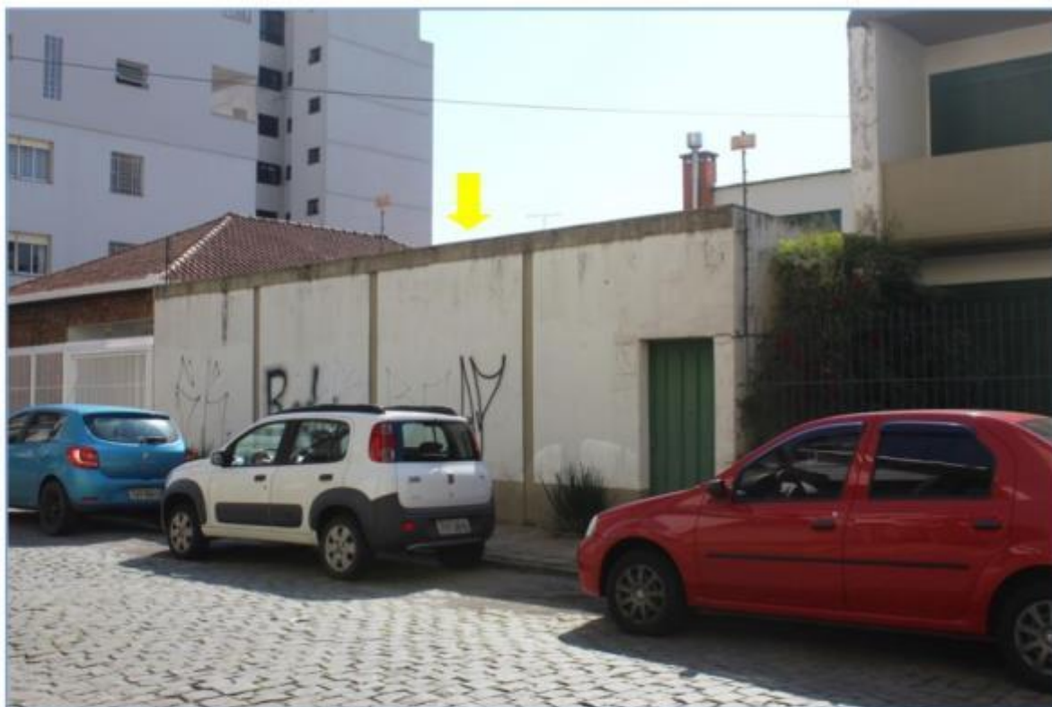
Imagem frontal do imóvel tratado na Matrícula 15.995.