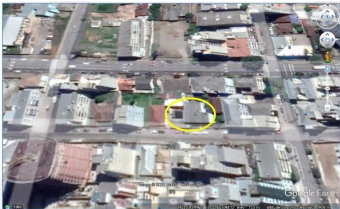
Imagem acima extraída do Google Earth, indicando a localização dos imóveis tratados nas Matrículas 15.995 e 19.176 situados na Rua Irma Valiera.