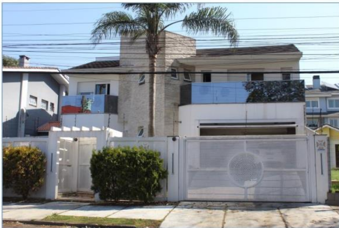
Imagem frontal do imóvel descrito na Matrícula 23.315